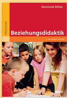
Beziehungsdidaktik 5., aktualisierte Auflage 2011 184 Seiten, broschiert € 24,95 D ISBN 978-3-407-25545-7