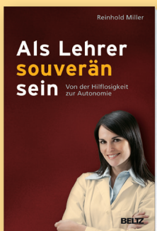
Als Lehrer souverän sein 2011, 236 Seiten, broschiert € 19,95 D ISBN 978-3-407-62754-4