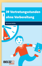
39 Vertretungsstunden ohne Vorbereitung »Schwellendidaktik pur« ab Klasse 5 Beltz pocket 2011, 142 Seiten, broschiert € 6,50 D ISBN 978-3-407-62793-3