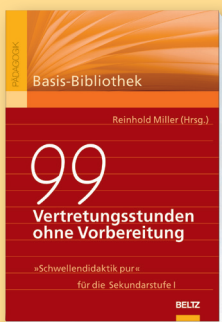
99 Vertretungsstunden ohne Vorbereitung »Schwellendidaktik pur« für die Sekundarstufe I 2009, 142 Seiten, broschiert € 19,95 D ISBN 978-3-407-25495-5